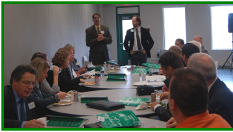
Rencontre préparatoire pour les animateurs

Nos sincères remerciements à tous les animateurs et secrétaires qui ont donné de leur temps pour l'animation des ateliers par MRC.